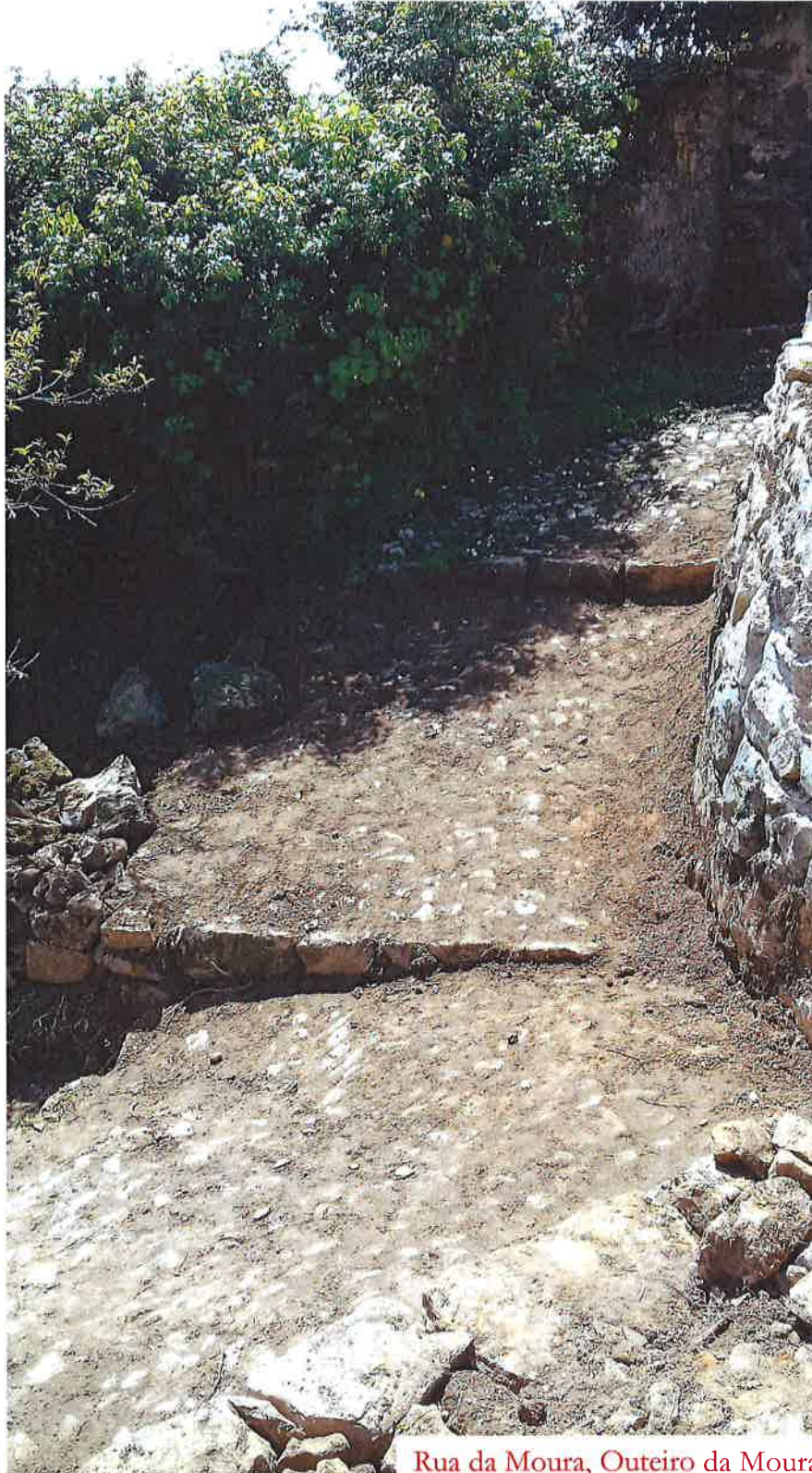
Rua da Moura, Outeiro da Moura