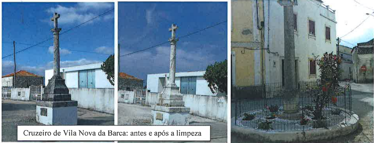
Cruzeiro de Vila Nova da Barca: antes e após a limpeza

Limpeza dos cruzeiros de Vila Nova da Barca e de Abrunheira. Recuperação e ajardinamento da rotunda do largo Dr. Alves Guardado, Verride.