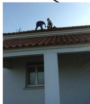
Centro de Dia de V. N. da Barca