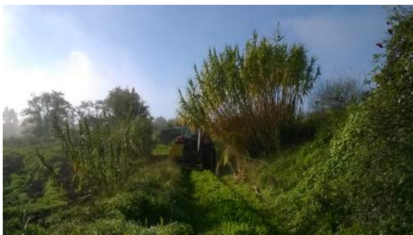
Caminho do Requeixo, Verride