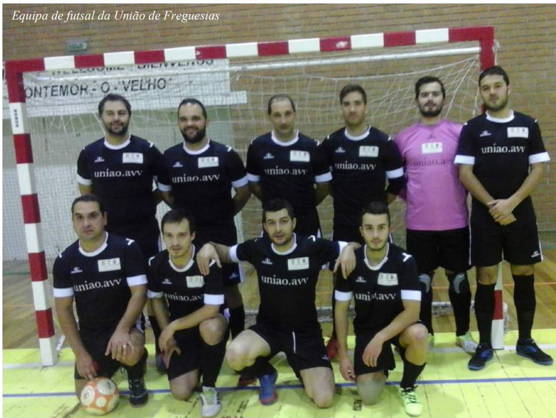
Equipa de futsal da União de Freguesias