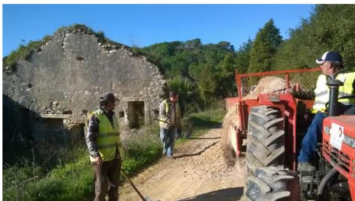
Caminho dos Cadoiços a Sevelha