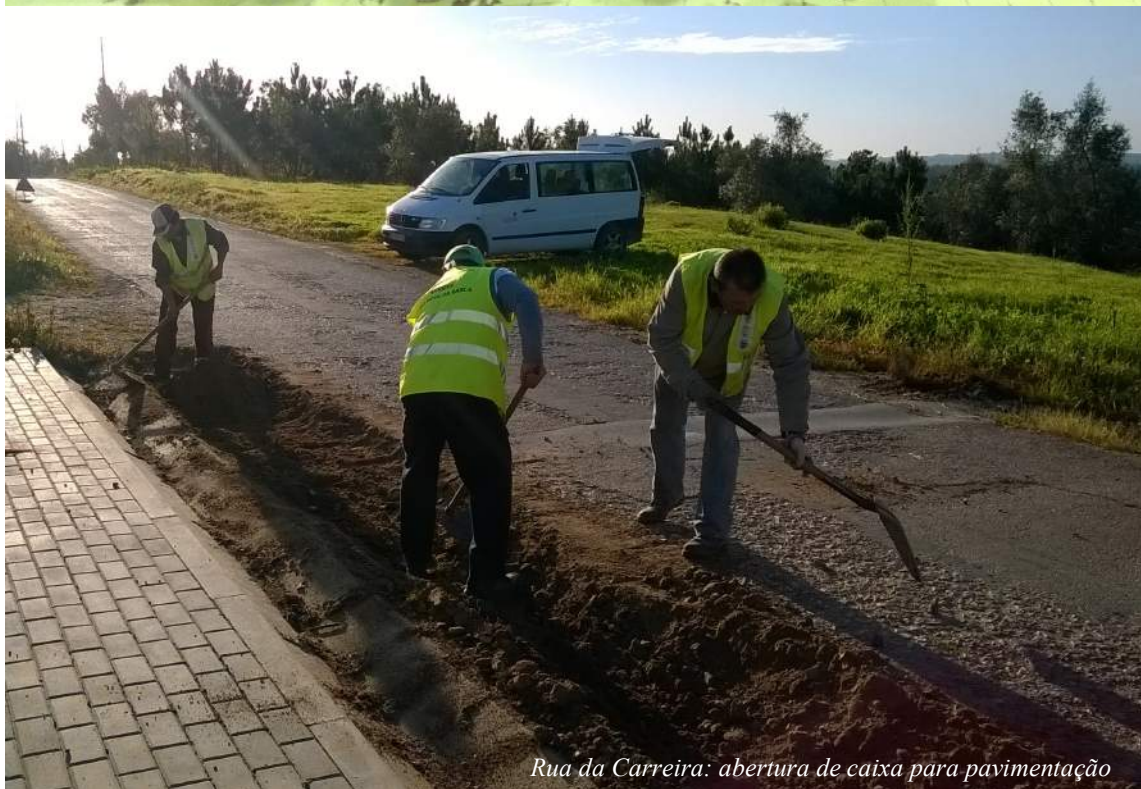
Rua da Carreira: abertura de caixa para pavimentação