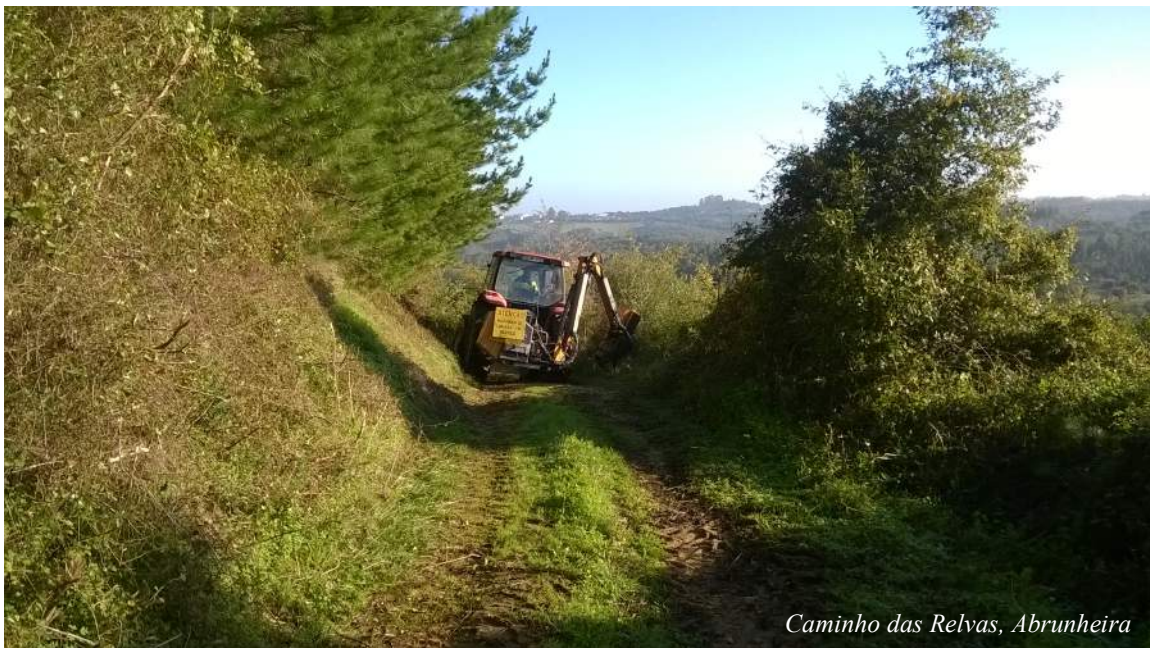
Caminho das Relvas, Abrunheira