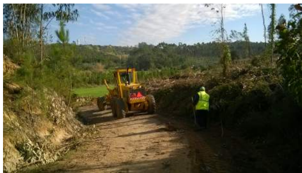
Caminho de Vale Salgueira, Abrunheira