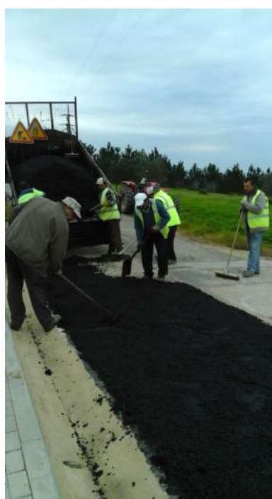
Rua da Carreira: pavimentação