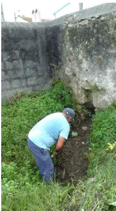
Caixeira: reabertura de passagens hidráulicas